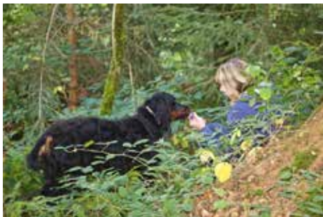
Belohnung: Jamie und Velvet haben sich die leckere Belohnung redlich verdient