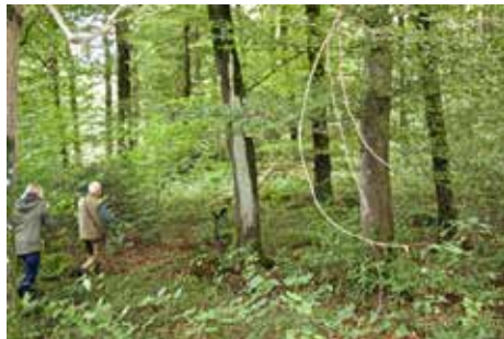
Trailen: Selbst im dichten Wald bleibt das Team auf der Spur