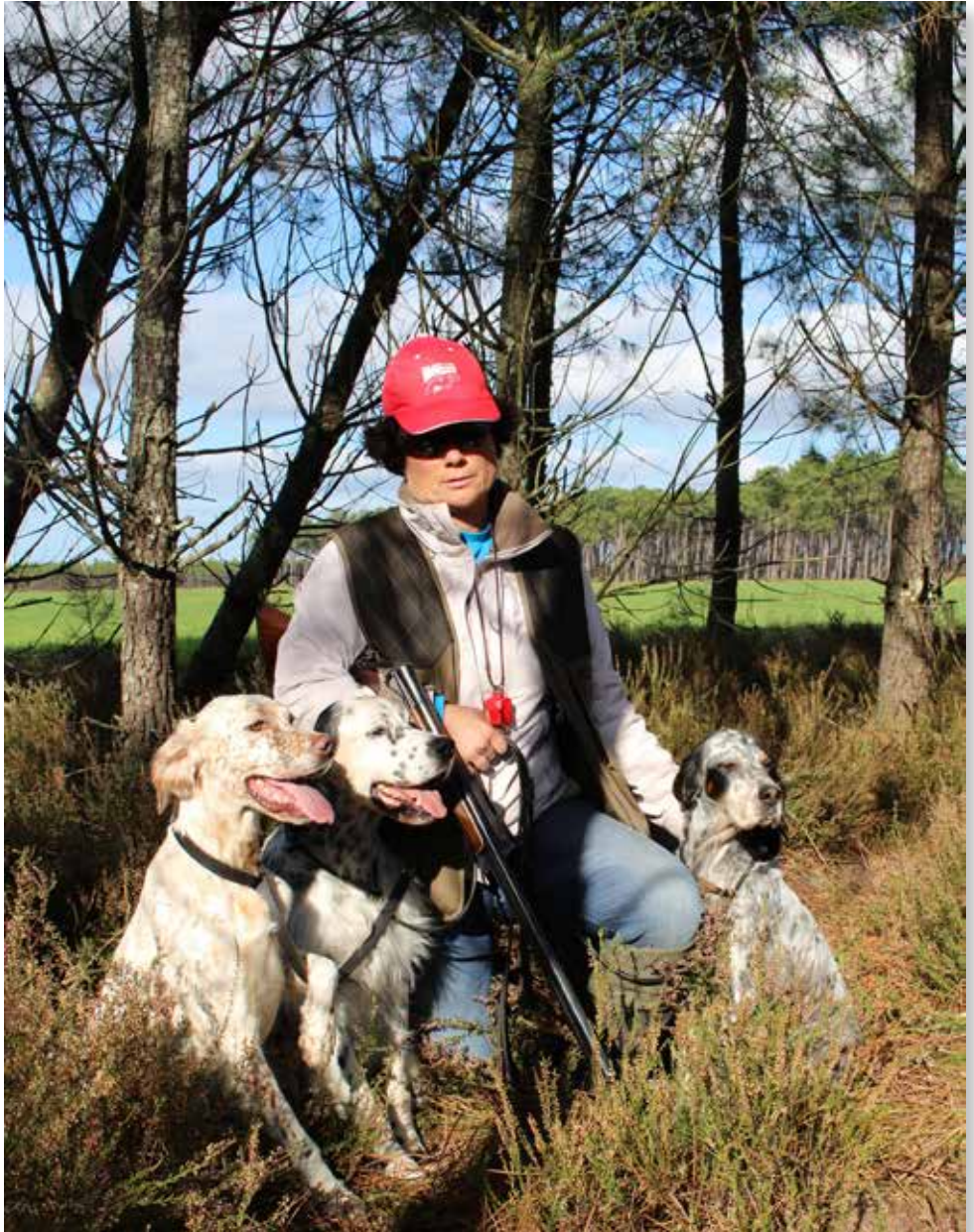
3-fach Weltmeisterin in St. Hubertus Frauen