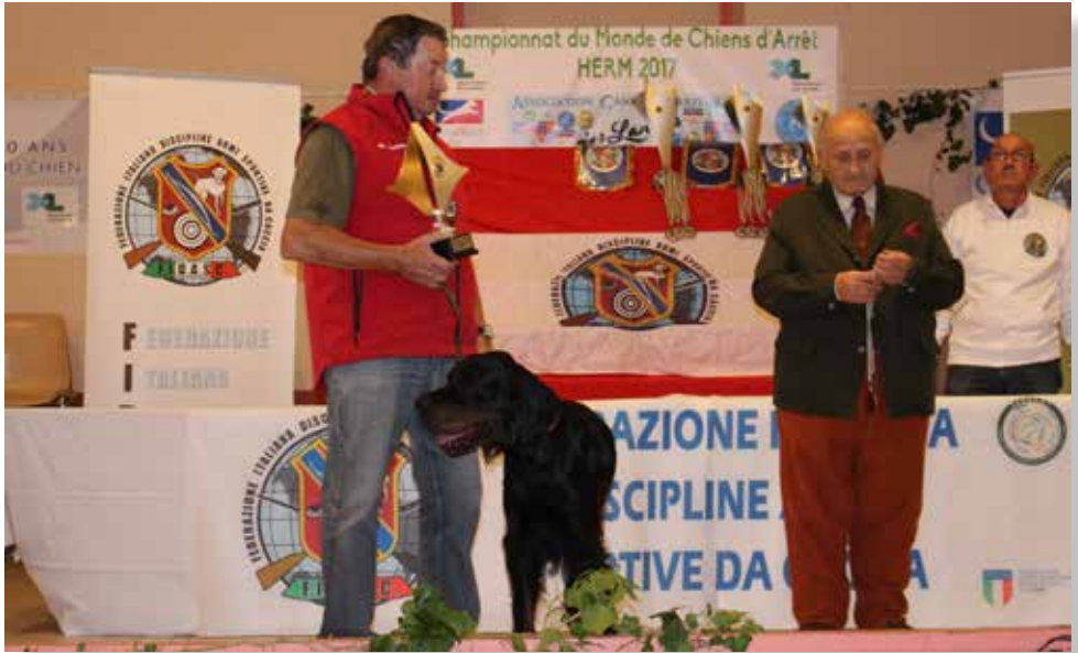
Fidelio du Clos de la Capitainerie