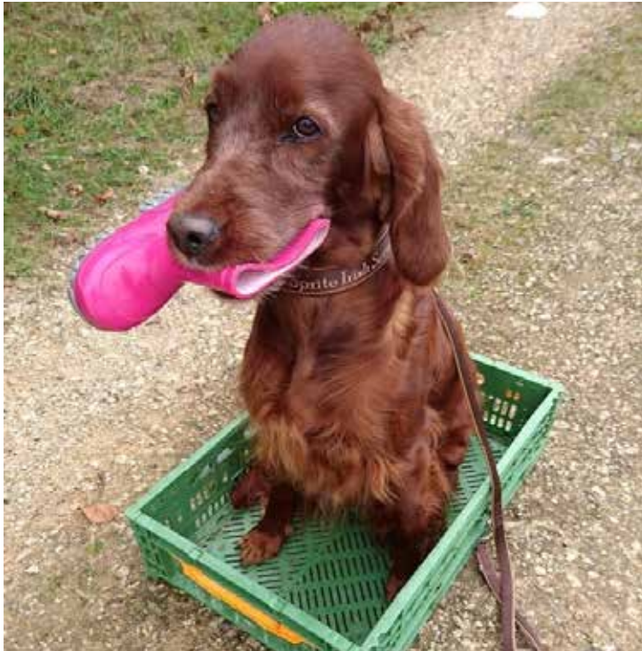
Konsequent, aber nicht mehr so ernst