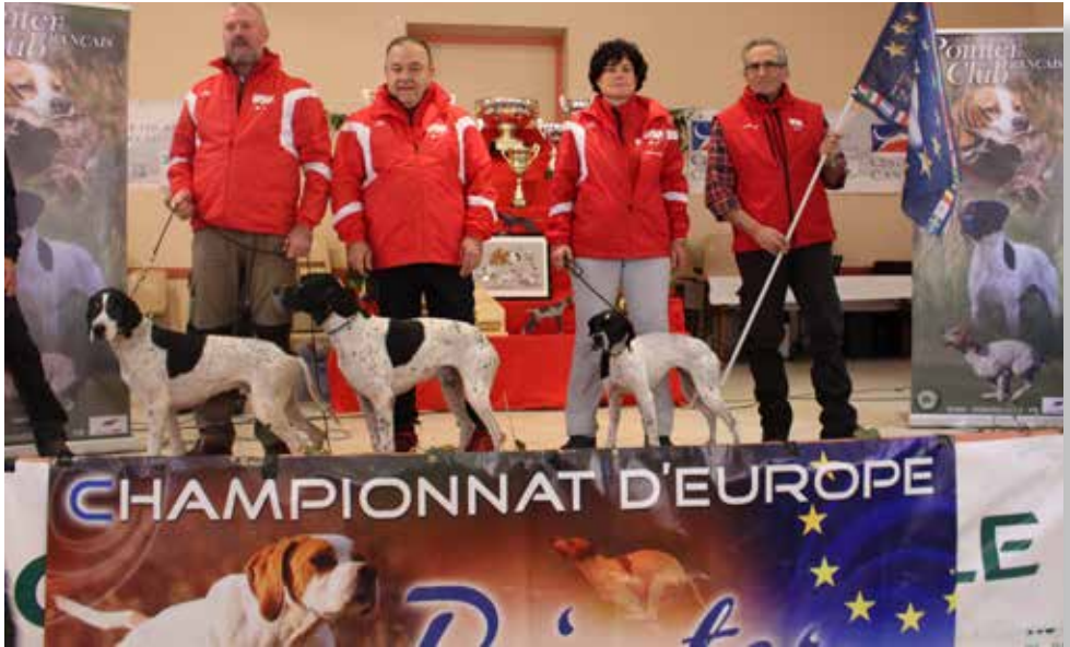
Mannschaft EM Pointer