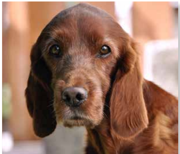
Bewegung hält Geist und Körper jung