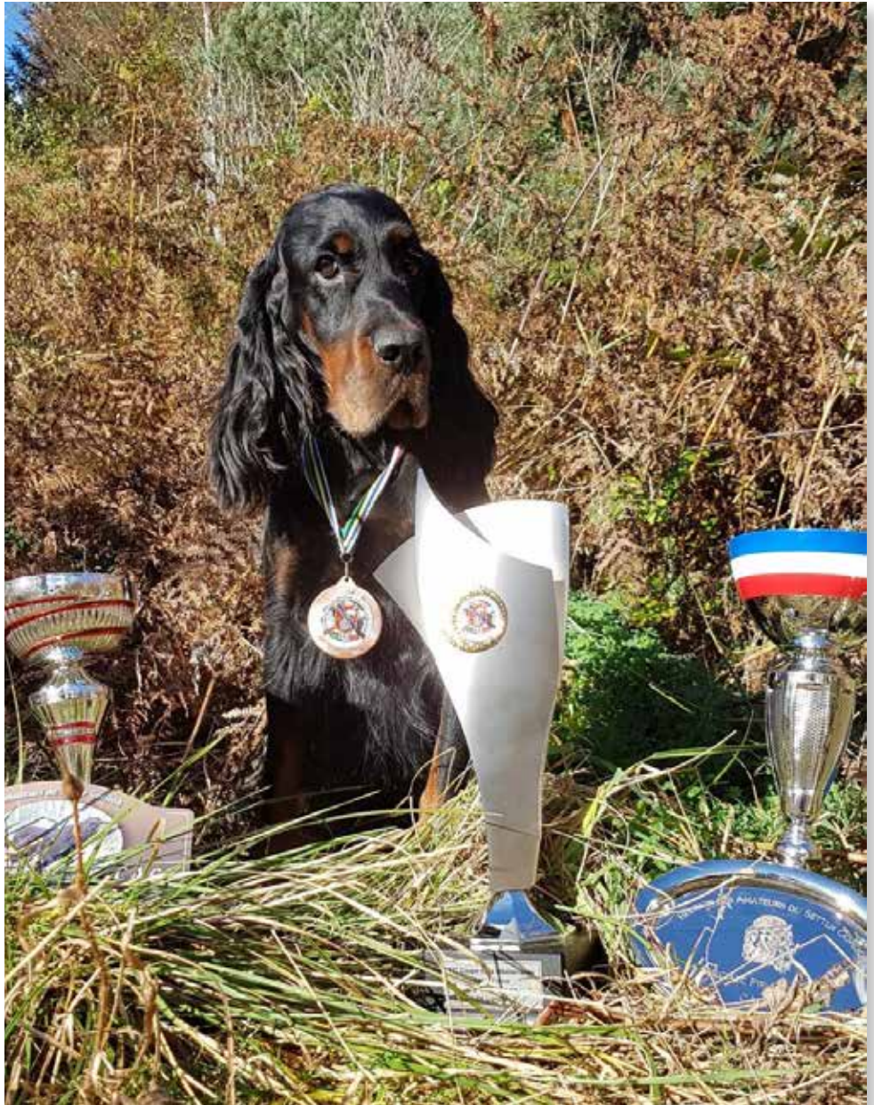
Fillies Gordon English Beauty