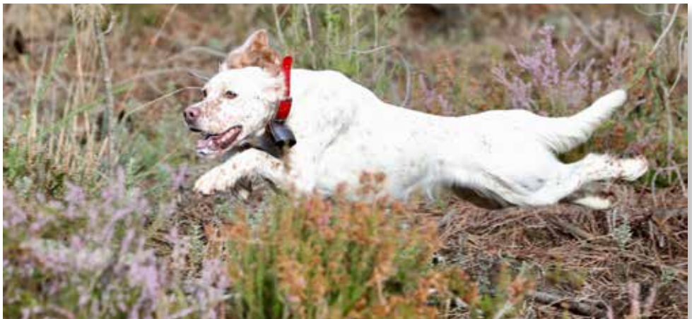
Duchesse du Tourbillon blanc