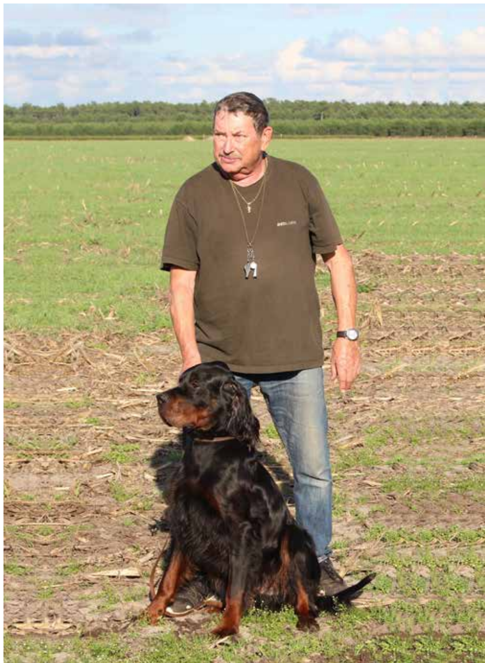
Fidelio du Clos de la Capitainerie