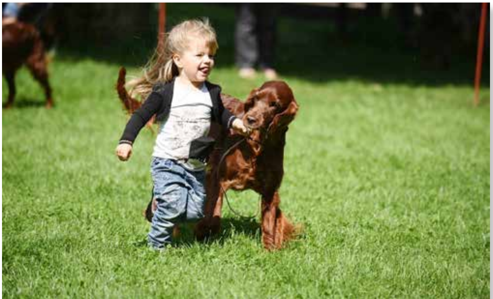
Die Zeit miteinander genießen