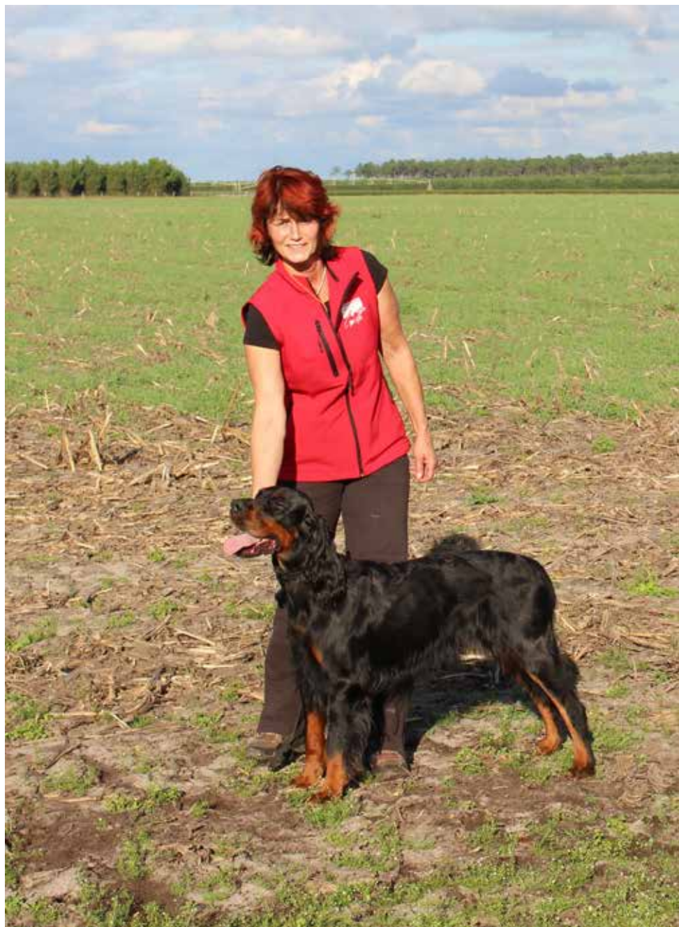
Fillies Gordon English Beauty