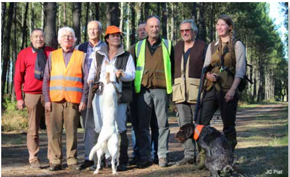
St Hubertus Weltmeisterin und Vizeweltmeisterin