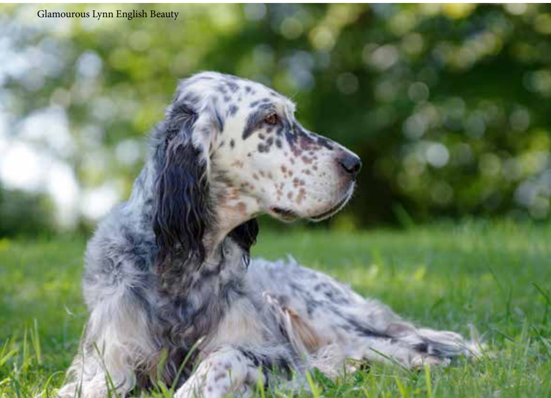
Glamorous Lynn English Beauty