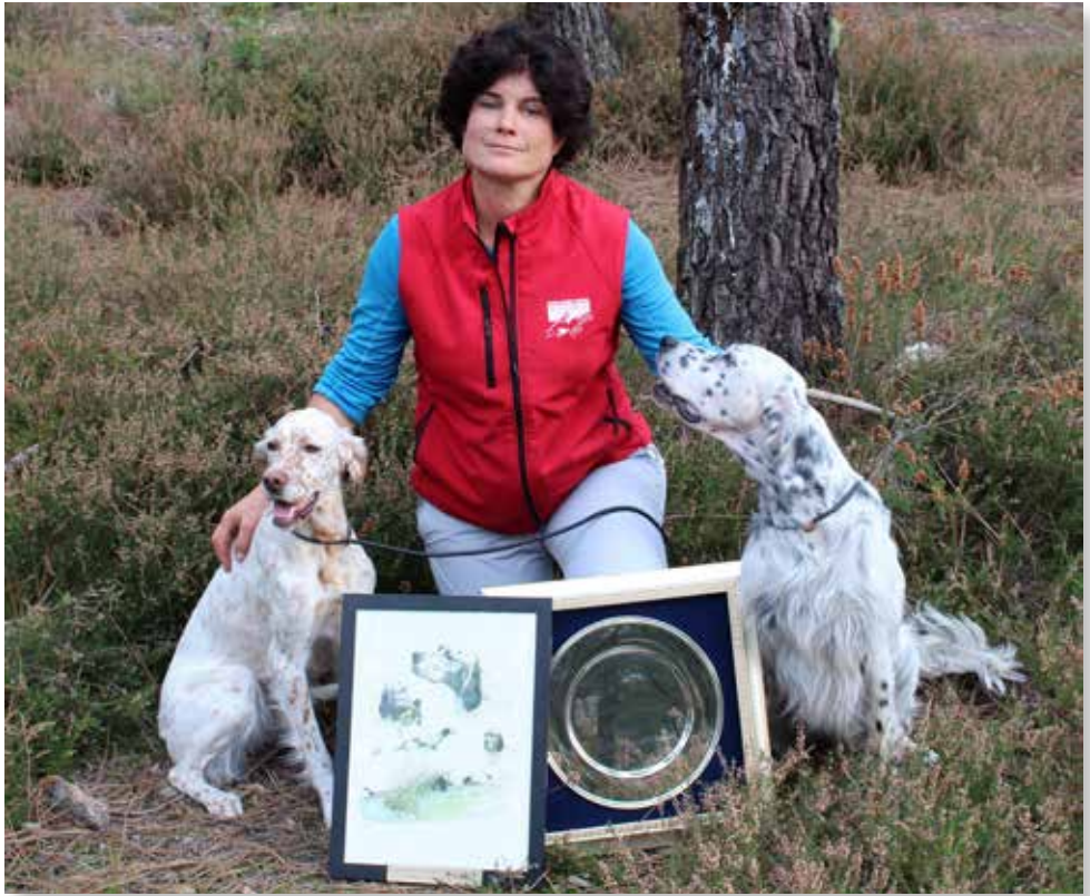
Duchesse und Cyrano du Tourbillon blanc