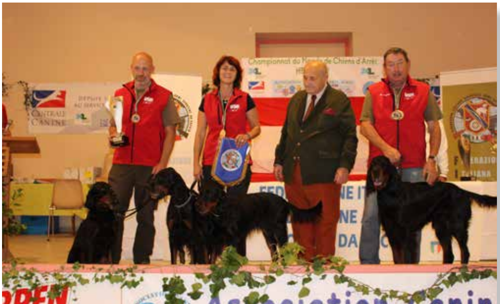
Illuminata des Quasars, Black Rider Noira, Fillies Gordon English Beauty, Fidelio du Clos de la Capitainerie